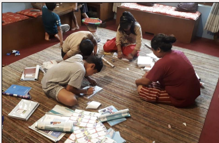
Thuisonderwijs tijdens de lockdown

Er zijn in 2021 geen nieuwe kinderen bij gekomen of weggegaan.